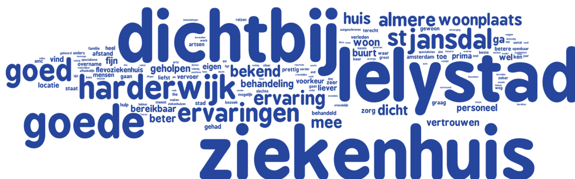
Woordwolk 2: Waarom gaat de voorkeur uit naar dat ziekenhuis?

In woordwolk 2 staat weergegeven waarom hun voorkeur uitgaat naar dat ziekenhuis. Meest genoemde redenen waarom de voorkeur uitgaat naar dat ziekenhuis is dat het dichtbij is en goede ervaring(en).